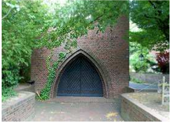
Ehemalige Lutherkapelle, jetzt St. Mikael's Kirche. Seit 1983 Gotteshaus der Äthiopisch Orthodoxen Kirche, das 2010 erworben worden ist.

ከፍ ብዬ እንደገለጽኩት ቤተ ክርስቲያን ለማስባረክ ወዲያ ወዲህ ሲባል ቤተ ክርስቲያኑን ለማስከልከል ተቃዋሚ የሆኑት ወገኖቻችን ተቃውሞአቸውን ለሰጡን ክፍሎች አቀረቡ። እስከዛሬ ድረስ እርዳታቸው ያልተለየን ማንፍሬድ ኮከ ጉዳዩን ለማየት ሁለቱን ወገኖች ለማነጋገር ቀጠሮ ተያዘ። አሁን እንግዲህ እኔም መገላገያዬ ቀን ደርሷል። እንዳገጣጣሚ ቀጠሮው መጋቢት 9 ቀን 1983 እ.አ.አ ነበር። እኔ መጋቢት ስምንት ሆስፒታል ገባሁ። በማግስቱ ባለቤቱም ልጆቻችንን ለበዕደ ማርያም ሰጥቶ ወደቀጠሮው ሄደ። ሁለታችንም በመጨረሻ፣ ቅድሚያ ለቤተ ክርስቲያናችን አገልግሎት ስላልን፣ እኔም፣ በሰው አገር አንድ ነገር ብሆን እንኳን አጠገቤ ሰው የለ ሳልል፣ እርሱም፣ ባለቤቱ በዚህ ጭንቅ ላይ እያለች እንዴት ትቻት እሄዳለሁ ማን አላት ቀጠሮው ይተላለፍ ሳይል ተለያየን። በቀዶ ጥገና ነበር የተገላገልኩት፣ እንደተመኘሁ ሴት ልጅ አገኘሁ። ስሟንም ጸጋ ማርያም አልናት። ቀን ላይ ዶ/ር በዕደ ማርያም ሳሙኤልን ከአጻደ ህጻናት አውጥቶ ወደ እኔ መጣ።