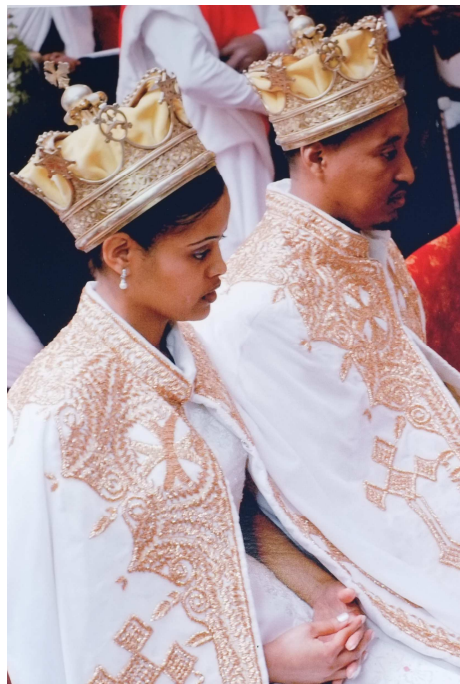
Braut und Bräutigam während der kirchlichen Trauung

ላለፉት ሠላሳ ዓመታት በጀርመን የኢትዮጵያ ኦርቶዶክስ ተዋሕዶ ቤተ ክርስቲያን አንድ ሙሉ ሰዉ ሊያከናውነዉ የሚገባዉን ተግባር ስታከናዉን ቆይታለች። በስደት ለሚገኙ ምእመናን ቤተ ክርስቲያን ከሀገር ወጭ የምትገኝ ሀገራቸዉ ከቤተሰብ ርቀዉ ቢገኙ ቤተሰባቸዉ፣ ከቤታቸዉ ቢወጡም ቤታቸዉ ናት። ቤተ ክርስቲያን እንኳን ከልጅነታቸዉ ጣዕሚን በቅርብ አዉቀዉ ላደጉ የእ ምነቱ ተከታዮች ቀርቶ ከዕለተ ክርስትናቸዉ በኋላ ደጅን ረግጠዉ ለማያዉቁ ግን