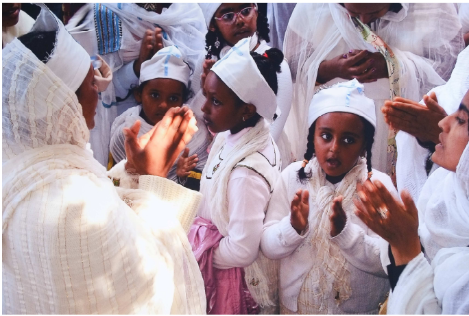
Kinderchor auf dem Patronatsfest des St. Mikael

«የቧ ዓመት ሐዋርያዊ ጉዞ በምዕራብ አውሮፓ» በሚል ርእስ ለመጻፍ ስነሣሣ ሁለት ዓላማዎችን ይገባ ሲሆን ፩ኛው የቀደመትን በማስታወስ፣ ሁለተኛው ወደፊት መከናወን ያለባቸውን ለመጠቀም ነው። ነገር ግን በቧ ዓመታት ውስጥ የተከናወኑት ተግባራት ዘርፈብዙዎች በመሆናቸው ከላይ እንዳየነው ሰፊ ብሎ ተብራርቷል። እንደዚሁም ከዛሬ ጀምሮ በነገው ራእይ የምንመለከታቸው ብዙዎች ቢሆኑም የተወሰኑትን በቅደም ተከተል እንመለከታለን።