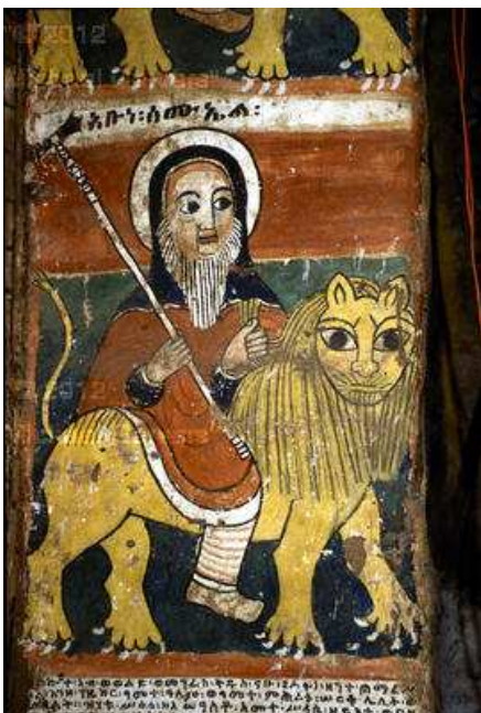
Heiliger Samuel von Waldeba

Der Heilige Samuel von Waldeba, Tsära, 19. Jh.