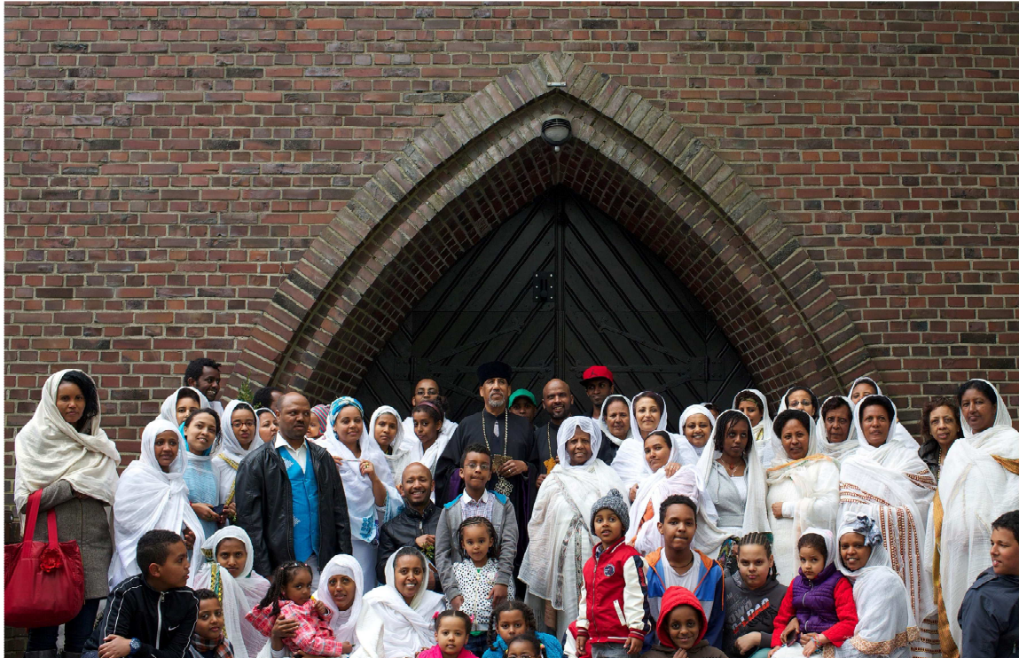
Kirchenmietglieder vor dem Kircheneingang

በዱስልዶርፍ፣ በኮሎኝ፣ በቦን፣ በኖይስ፣ ሙኒክ፣ ኤሰን፣ ሙንስተር፣ በርሊን፣ በፍራንክፈርት፣ በሽቱትጋርት፣ በሃምቡርግ ከተማዎች ወዘተ እንዲሁም በጎረቤት ሀገሮች የሚኖሩ በዚህ ረዥም ዘመን ቤተ ክርስቲያን ለልጆቻቸው በመንፈሳዊም ሆነ በዓለማዊ ሕይወት ምን አስተዋጽኦ አድርጋለች ብለው እንደሚያምኑ የጠየካቸው ምእመናን፣ ይህን የሚለኩበት ቃላት እንደሚያንስ በመጠቀም ከዘረዘሩልኝ ከብዙ በጥቂቱ ላስፍረው።