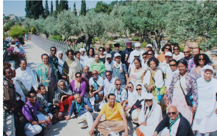
Pilgerreise ins Heilige Land (2013)

መንፈስ ቅዱስ ብቻ ባወቀ በጎሮጎሮሳዊዉ የዘመን ቀመር 2007 ዓ ም ላይ ሊቀ ካህናት ዶክተር መርዓዊ ተበጀ ኢ የሩሳሌምን እንሳለም የሚል ሀሳቦችን ለምእመናን ሁሉ በምድረ ጀርመን በሚገኙ በየሄዱባቸዉ አብያተ ክርስቲያናት ሁሉ አቀረቡ። በመጀመሪያዉ የጥሪ ደወል ልባቸዉ የተነካ ከአርባ በላይ ምእመናን ተሰባስቡና የትንሣኤን በዓል በኢየሩሳሌም ለማክበር ተጓዙ። እዚህ የቀረነዉ ደግሞ በመንፈስ አብረን ተጓዘን። በረከታችሁ ይድረሱን እያልን። ሊቀ ካህናት በወቅቱ የጉዞዉ አስተባባሪና መሪ ነበሩ። እኔ በተራዬ ከወንድሞችና ከአንዲት እጎት ጋ የጉዞ ማስተባበር ኃላፊነትን ላለፉት ሁለት ዓመታት ተረከቤ ሂደቱን በቅርብ ስመለከት፣